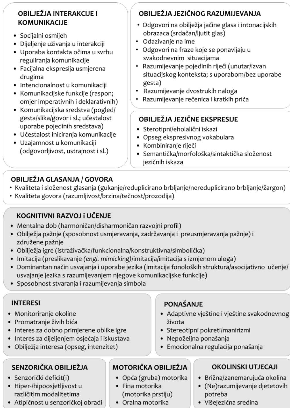
Slika 2. Razvojne domene koje uključujemo u procjenu rane komunikacije

(socio)kognitivne pretpostavke komuniciranja za te funkcije.