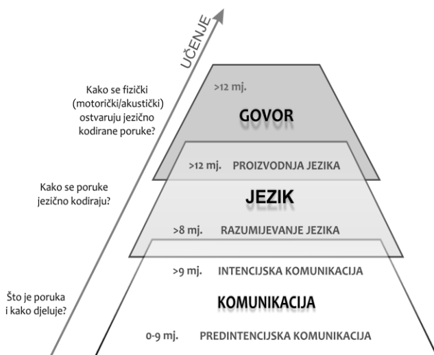
Slika 1. Razvojna piramida razvoja komunikacije, jezika i govora

Komunikacija je temelj i potporni stup usvajanja jezika i razvoja govora: a) jezik se uči u komunikaciji, b) govor je jedno od sredstava koja koristimo u komunikaciji, c) razvojna ekspanzija jezično-govornih sposobnosti nastaje nakon što dijete nauči kako porukom utjecati na pažnju druge osobe, tj. nakon što su usvojene osnove komunikacije. Važno je uočiti da prije nego što počne govoriti (prve riječi sa značenjem uglavnom se javljaju u dobi od 12 mjeseci, a rječnički brzac u dobi od 18 mjeseci), dijete mora usvojiti niz znanja i vještina, koje će mu omogućiti da postane komunikacijski aktivno i “pripremi se” za usvajanje jezika.